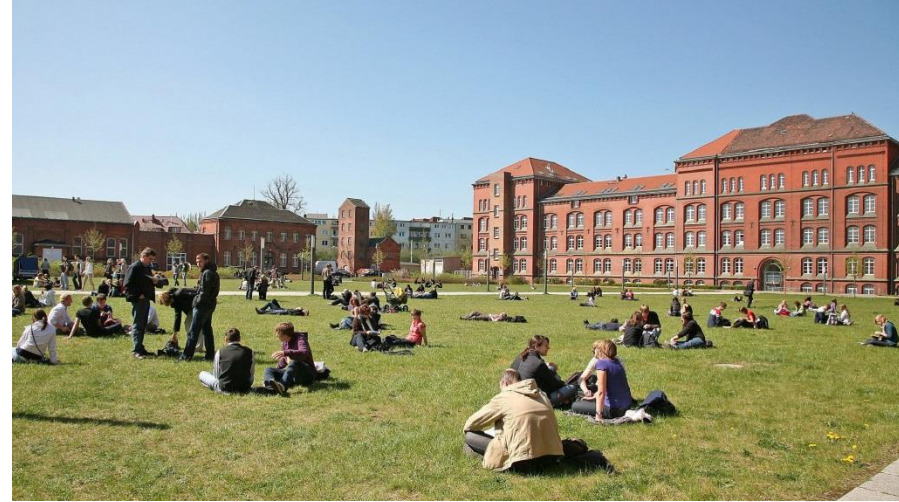
Campus Ulmenstrasse

1419 gegründet = drittälteste Hochschule Deutschlands + älteste Universität im Ostseeraum n = 12.815 Studierende (2024/2025)